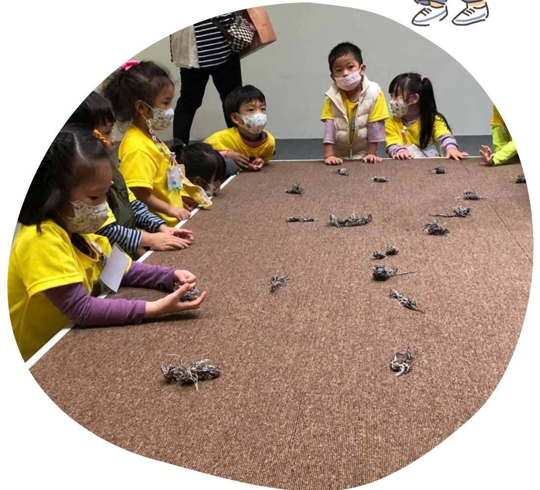
好想踢踢看小毛球