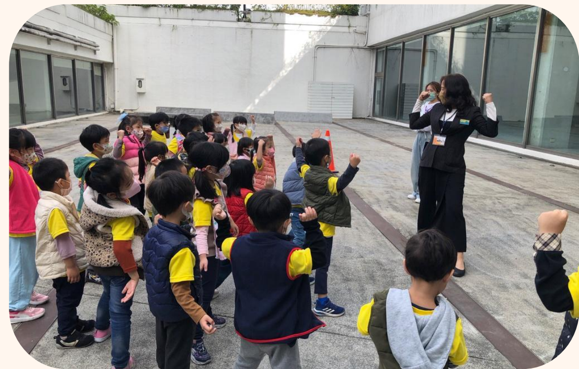
導覽前身體動一動