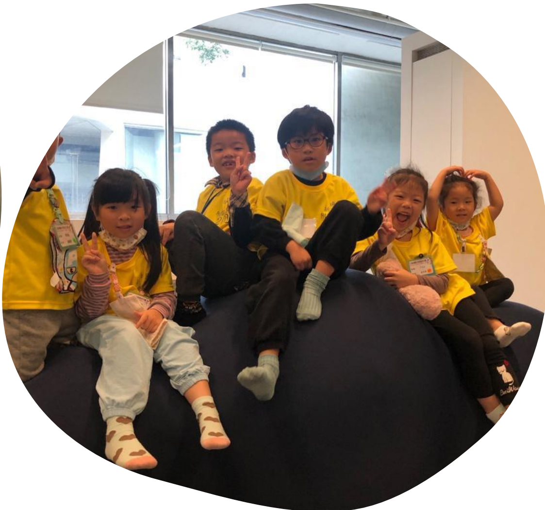
玩期待已久的岩漿區