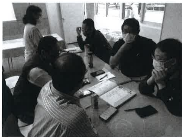
研討各年級三次段考命題範圍及備課