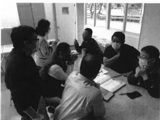
說明、分配及抽籤認領本學期各項工作事項