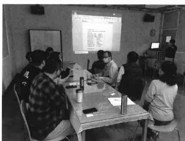
主席主持會議並說明轉知事項