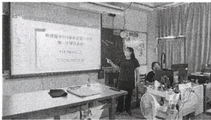
協助教務處事項說明