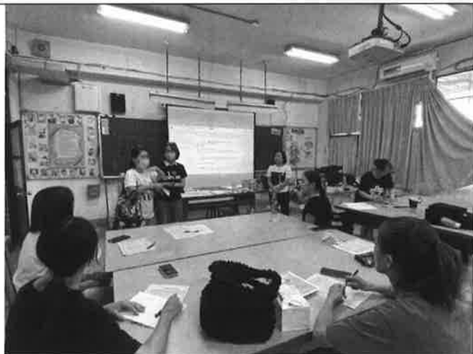
校長、教務主任參加藝術領域會議